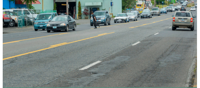
在项目通道中, 需要对 SE 82nd Avenue 的现有道路进行维修升级